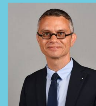
Renaud Payre Vice-président de la Mé- tropole de Lyon - Habitat, logement et politique de la ville