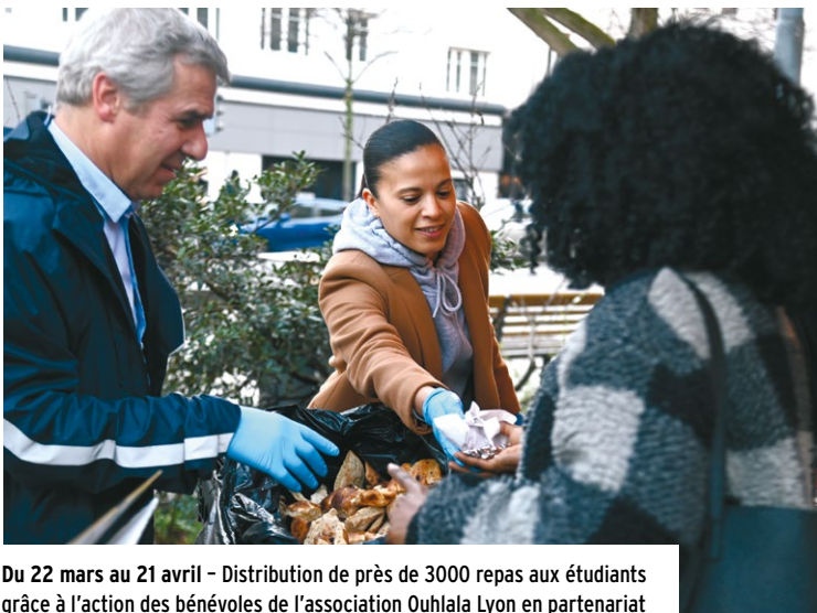
Du 22 mars au 21 avril - Distribution de près de 3000 repas aux étudiants grâce à l'action des bénévoles de l'association Ouhlala Lyon en partenariat avec la boulangerie Millet et la Mairie du 8 e .