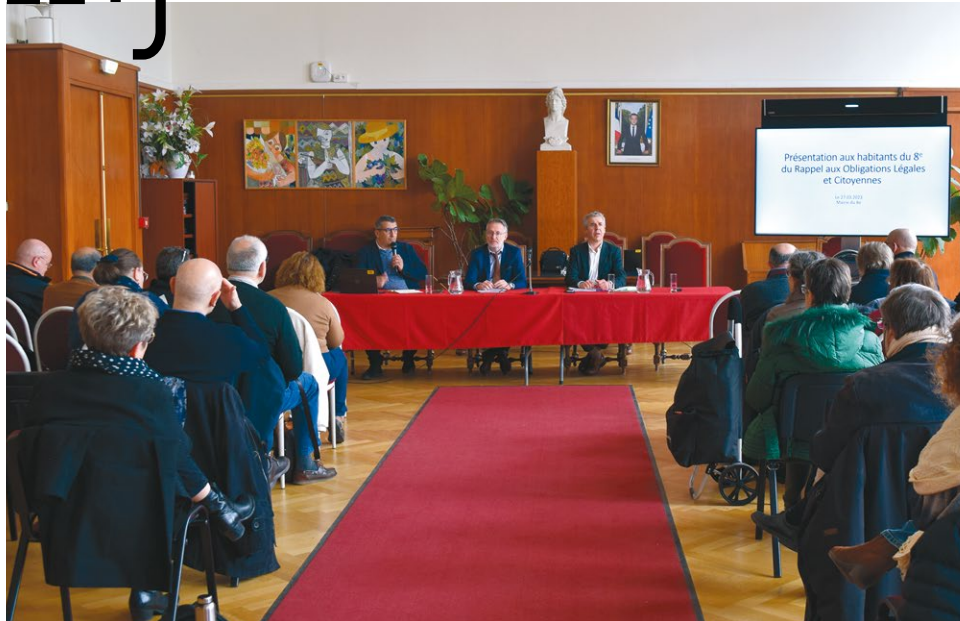
28 mars - Rencontre entre le procureur de la République et les conseils de quartiers pour échanger sur l'action de la justice et le « Rappel aux Obligations Légales et Citoyennes (ROLC) » pour lutter contre les incivilités du quotidien et la petite délinquance.