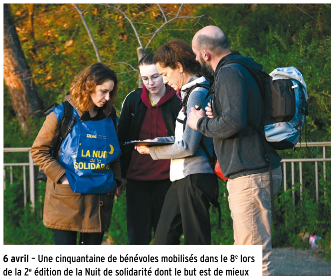
6 avril - Une cinquantaine de bénévoles mobilisés dans le 8 e lors de la 2 e édition de la Nuit de solidarité dont le but est de mieux connaître les personnes vivant dans la rue.