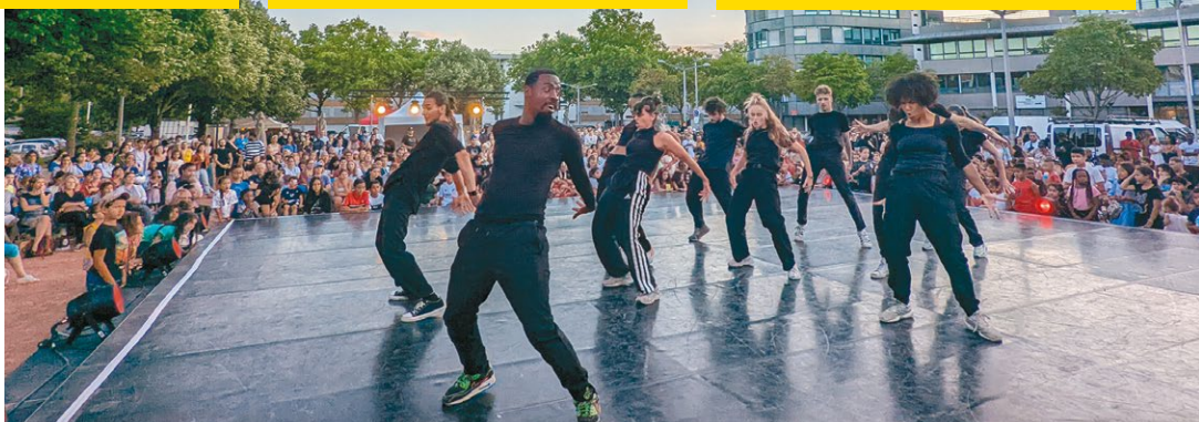
Festival Acordanse