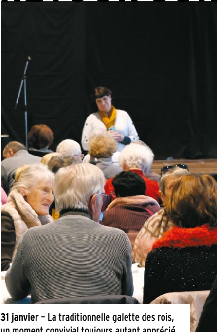
31 janvier - La traditionnelle galette des rois, un moment convivial toujours autant apprécié des seniors.