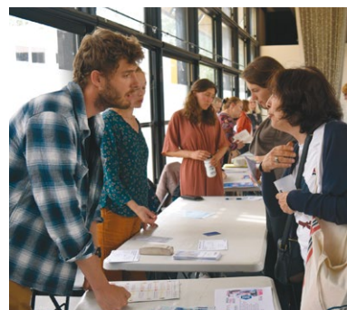
Forum du «mieux-être» en mai dernier