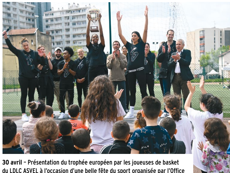
30 avril - Présentation du trophée européen par les joueuses de basket du LDLC ASVEL à l'occasion d'une belle fête du sport organisée par l'Office des sports et la Mairie du 8 e à l'espace Saez et au gymnase Cavagnoud.