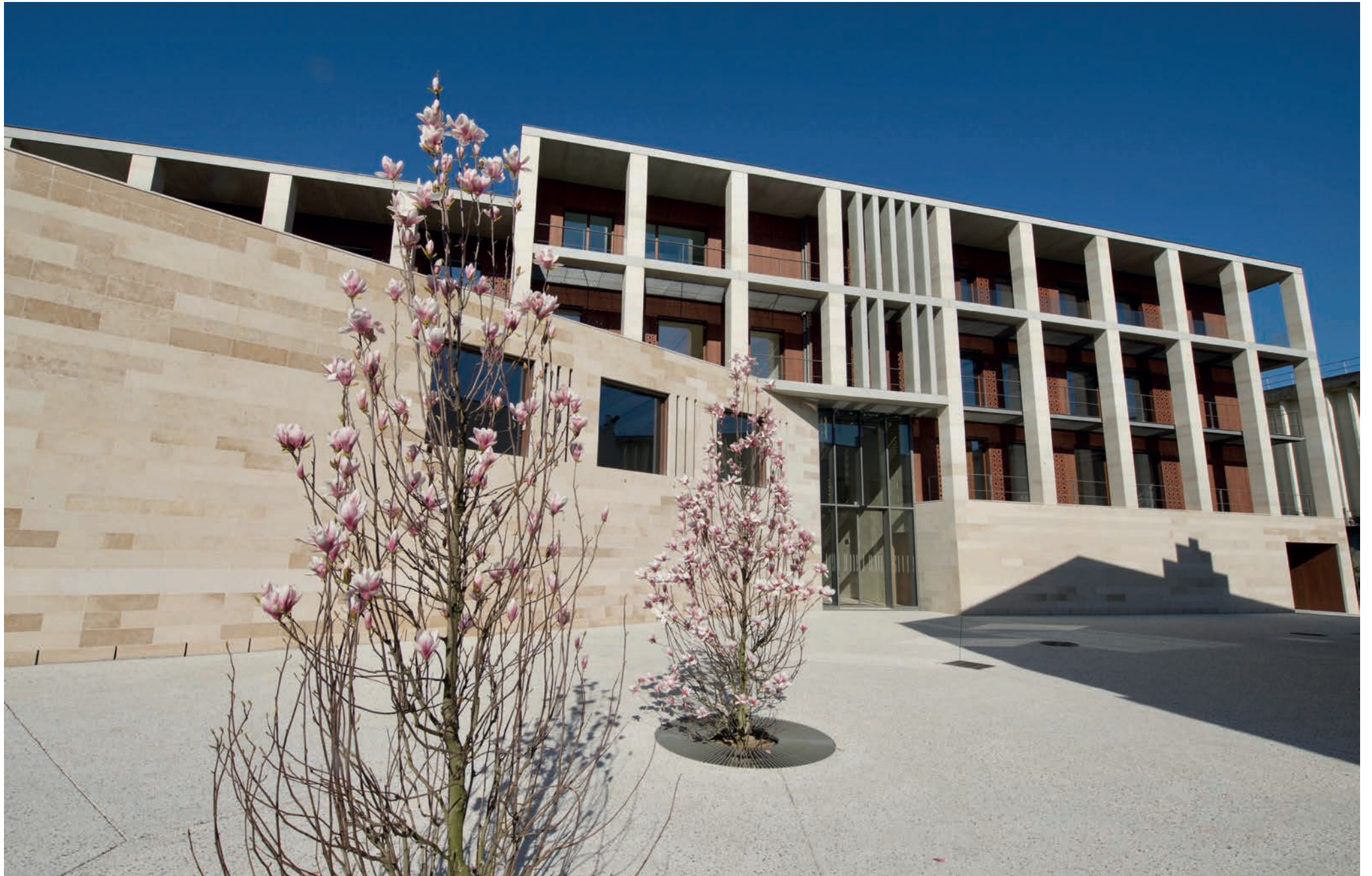
Façade Est trois quart