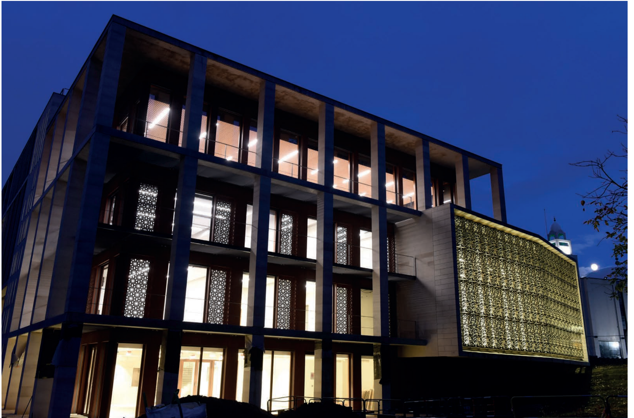
Côté salon de thé de nuit