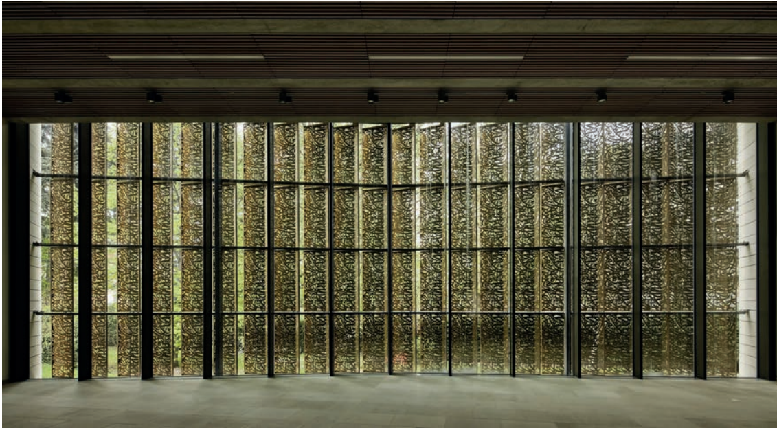
Espace d'exposition Nasreddine Etienne Dinet