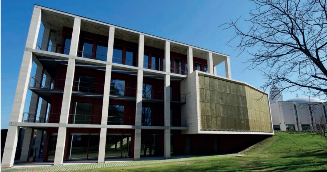
Au rez-de-chaussée de l'IFCM, le salon de thé donne sur le jardin