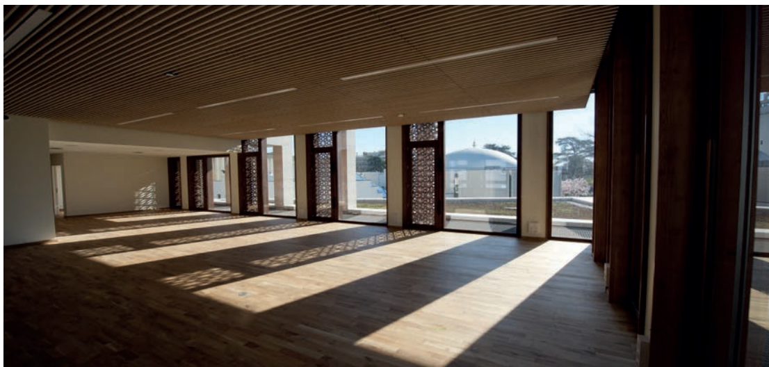
Médiathèque Professeur Badreddine Lahneche

Au cœur de l'IFCM, la médiathèque est un espace de documentation ouvert à tout public. Elle affiche plusieurs ambitions : offrir des ressources documentaires nécessaires à la connaissance des cultures musulmanes, proposer un lieu dédié à la créativité et au travail de groupe, cultiver la diversité de tous les publics, s'ouvrir sur la ville et à son milieu universitaire ainsi que ses bibliothèques, innover et donner des repères sur la culture musulmane, et attirer les scolaires et l'enseignement.