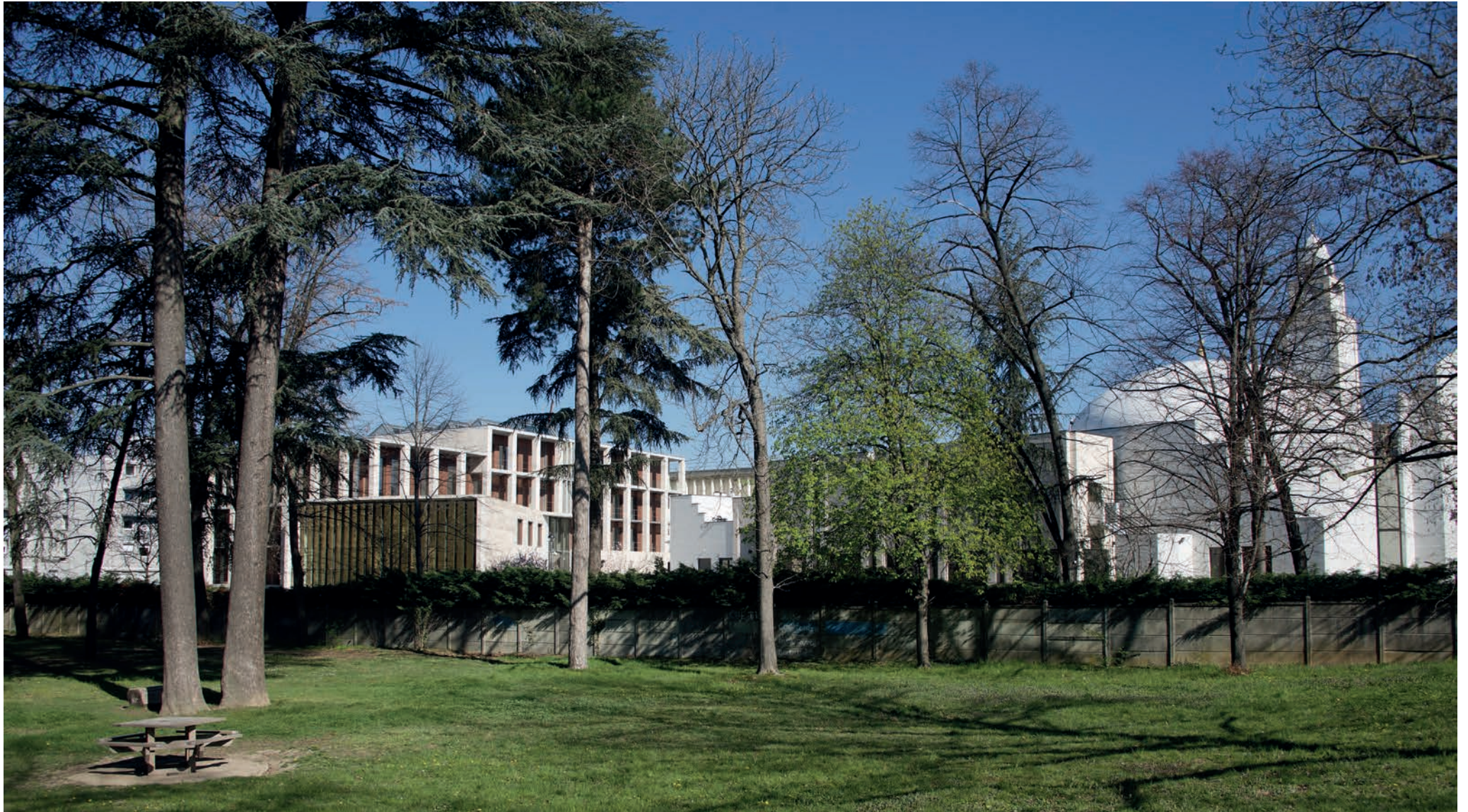
Accolé au jardin Antoine Perrin, l'IFCM bénéficie d'un environnement privilégié